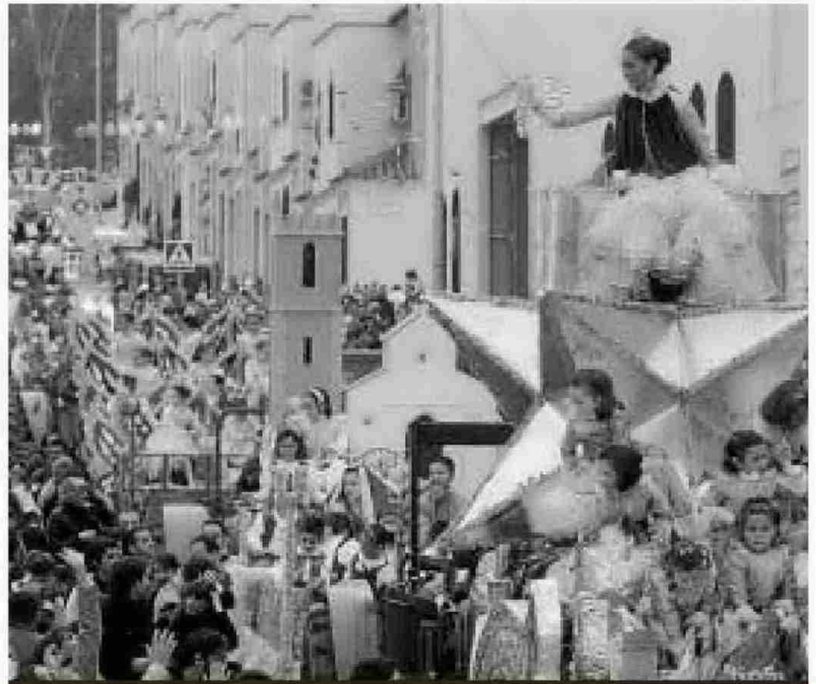
Castilleja de la Cuesta. La Banda de Cornetas y Tambores Nuestro Padre Jesús de los Remedios y la Agrupación Musical María Inmaculada ponen música a esta cabalgata.